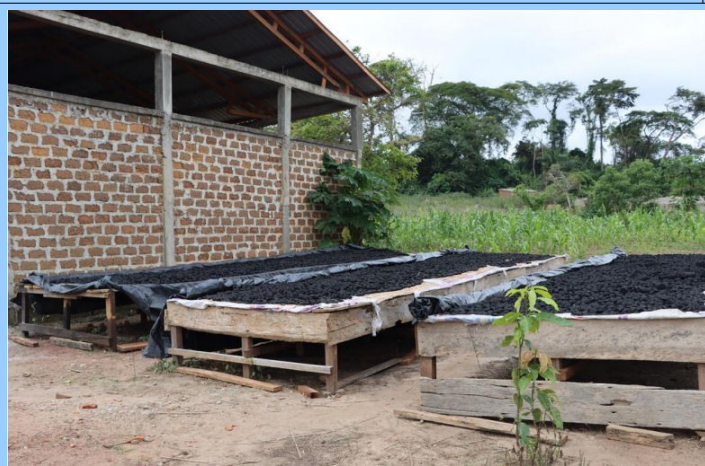
Lieu de production en forêt tropicale du Sud

lieu de livraison en région sèche sahélienne du Nord où le bois est raréfié.